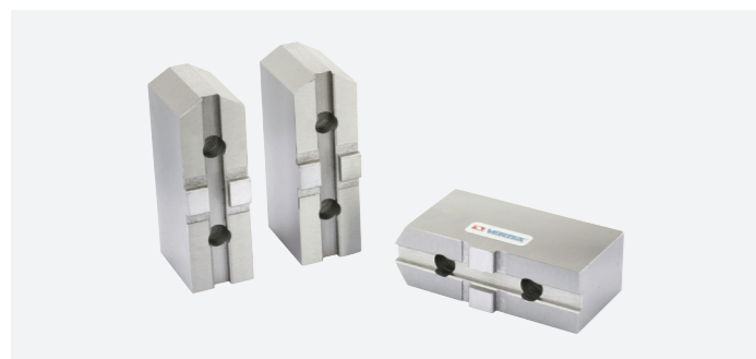
לחיים רכים לפוסר הידראולי במידות סטנדרטיות (סט 3 יחידות)

מעמד ל-64 מחזיקי כלים BT30 VERVTT-1-30A מעמד ל-56 מחזיקי כלים BT40 VERVTT-1-40A עגלת כלים על גלגלים למחזיקי כלים BT50 VERVTT-2-50 ארון 24 מגירות בגודל 440X222X642 מ"מ VERVA7-324P ארון 75 מגירות בגודל 586X222X937 מ"מ VERVA1-575