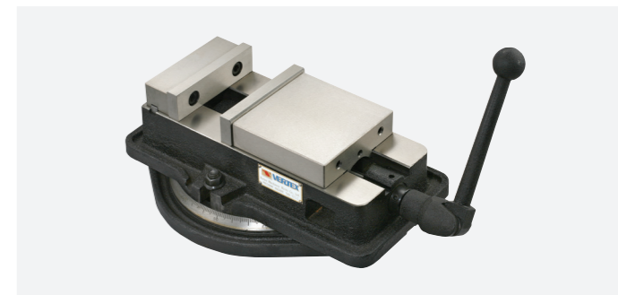
מלחציים למכונת כרסום עם אפשרות לכוונון זוויתי