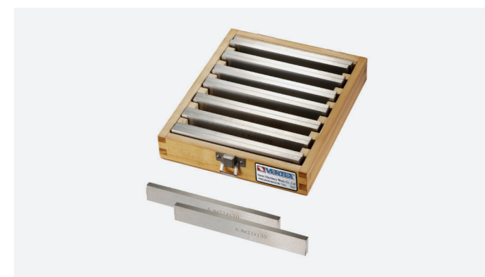
סט מקבילונים מדויקים/מושחזים בקושי של HRc 48-53

VERVP-136 VERVP-118A VERVP-018 VERVP-163 VERVP-128A VERVP-100