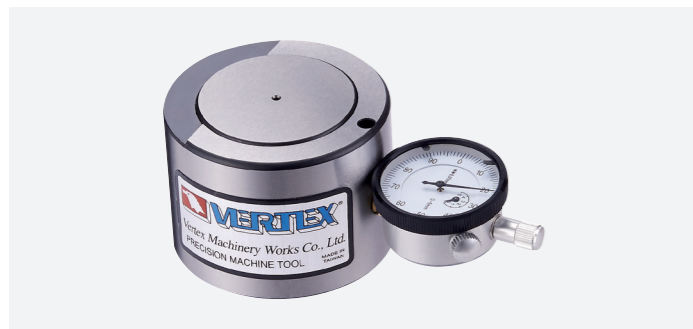
מכשיר לאיפוס גובה בכרסומת הכולל שעון

VERHP-50AM VERHP-100 VERHP-50ZM VERHP-50A