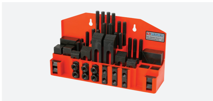
סט ברגים, אומים, מעצורים וקלמרות מפלדה, לדפינה

VERHP-50AM VERHP-100 VERHP-50ZM VERHP-50A