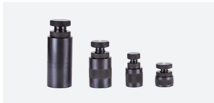
מעצורי תמיכה מתכווננים מפלדה איכותית