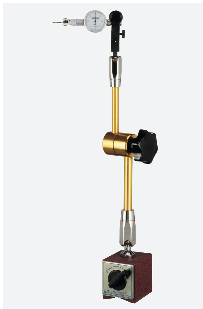
זרועות מתכווננים מגנטיים לשעוני מדידה (אינדיקטורים)

VERVCP-25 VERVCP-1 VERVCP-26 VERVCP-2 VERVCP-27 VERVCP-3 VERVCP-29 VERVCP-5 VERVCP-6