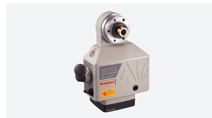
מנועים להנעת צירים: X,Y,Z SUPERPOWER TABLE FEED

VERVMF-102A VERVMB-106H VERVMB-01 VERVMB-70 VERVMB-106